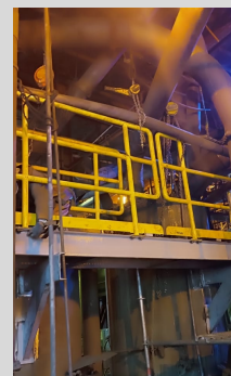
Levantamiento de observaciones de seguridad en las plantas de Molibdeno y Filtros de Concentradora 1 - SPCC