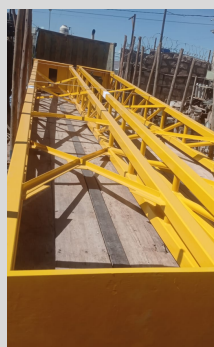
Fabricación y Mantenimiento de Rastra muelle F - TISUR