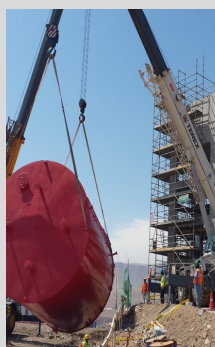
Fabricación y montaje de Tanque Contra incendio - TISUR