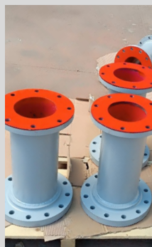
Fabricación spools ANGLOAMERICAN UM Quellaveco - Moquegua