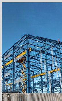
Fabricación y montaje de nave industrial - FL SMIDTH - THYSSEN KRUPP