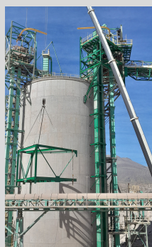
Estructuras de plataformas metálicas para elevador de cangilones para Silo 8 - YURA