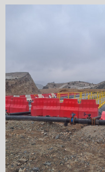
Construcción de canales forrados de Geomembrana Presa Linga - CERRO VERDE